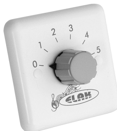
Na slici : EAT 1030 / EAT 1050