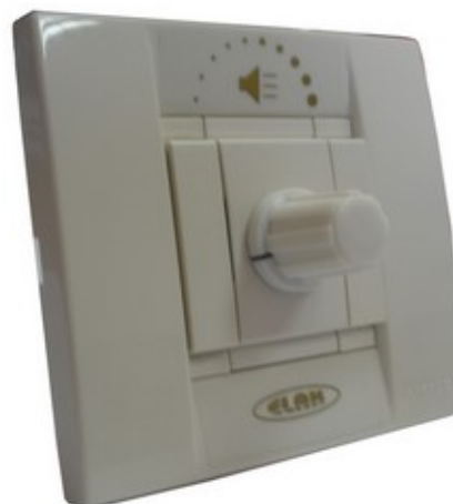
Na slici : EAT 1030V—Vimar izvedba