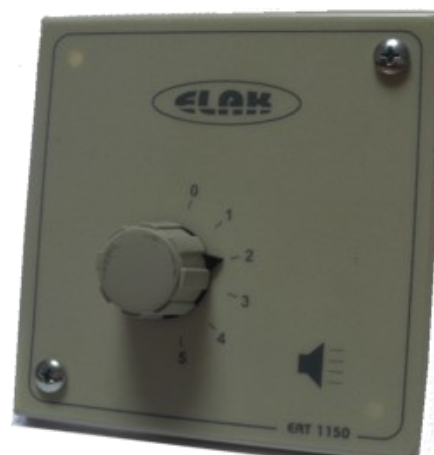
Na slici : EAT 1150